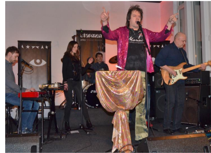
„Heroes just for one day“: die Coverband Starmen